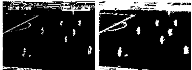
図 2: (左) : Sobel オペレータによる 2 値画像例 (右) : 提案手法による 2 値画像例