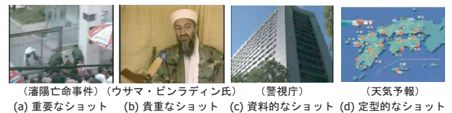
図 1: 繰り返し利用される映像ショットの例

像の一つとして、トピックに含まれる同一映像ショットを抽出する方法を提案する。ただし、ニューストピックの概要を把握できるようにするためには、対象のトピックのみならず、そのトピックに関連するトピックの内容も同時に表現できることが望ましい。また、同一映像ショットの数は多くないため、単一のトピックに含まれる同一映像ショットが抽出できない場合も考えられる。そこで、キー画像の取得に際しては、トピック構造において、対象のトピック（主トピック）から派生するトピック群（トピッククラス）に含まれる同一映像ショットを抽出することとした（図 2）。