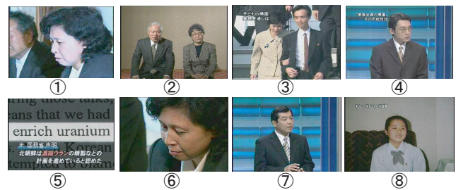
図3: 拉致被害者に関するあるトピッククラスのキー画像

「拉致被害者」に関するあるニューストピック (2002年10月16日トピック#1) から派生するトピッククラス (3階層) を代表すると判定されたキー画像、上位8画像を図3に示す。この例では、トピッククラスは36トピックから構成され、関係する同一映像ショットは57種類であった。キー画像としては、帰国した拉致被害者らの画像を中心に、被害者の親族、北朝鮮核施設などに絡む画像が得られた。