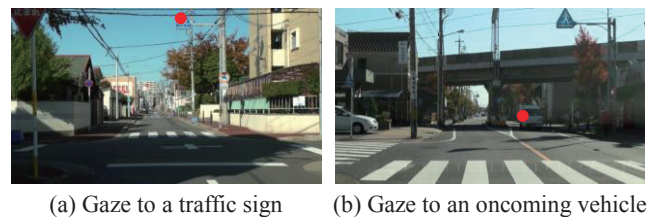
Fig. 2. Examples of gaze points (red circles)

置を分析すると、進行方向 (消失点) 付近に視線が向けられている割合は約 27%であった。それ以外には、Fig. 2 に示すように、運転上重要となる物体 (道路標識, 信号機等), 移動物体 (対向車両や歩行者等) に向けられた視線が多かった。